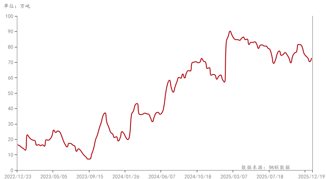
纯碱：轻质：库存：中国（周）