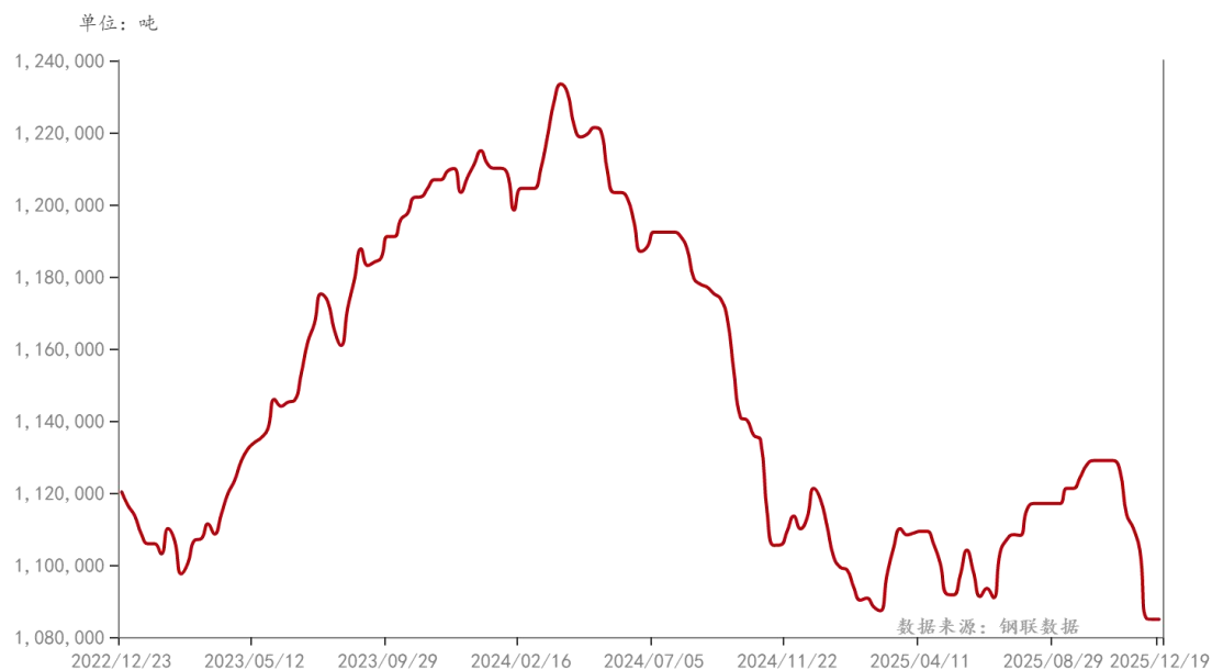
浮法玻璃：产量：中国（周）