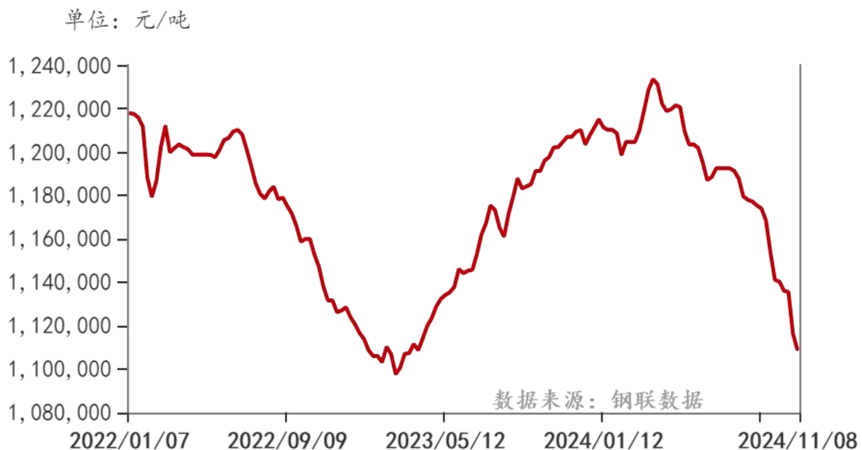
浮法玻璃：产量：中国（周）