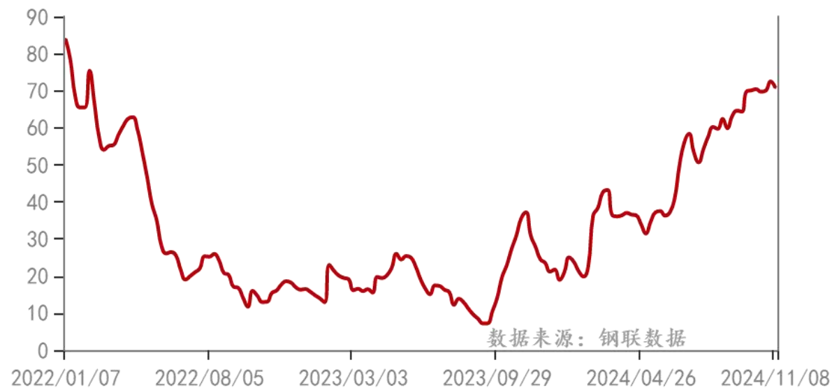
纯碱：重质：库存：中国（周）