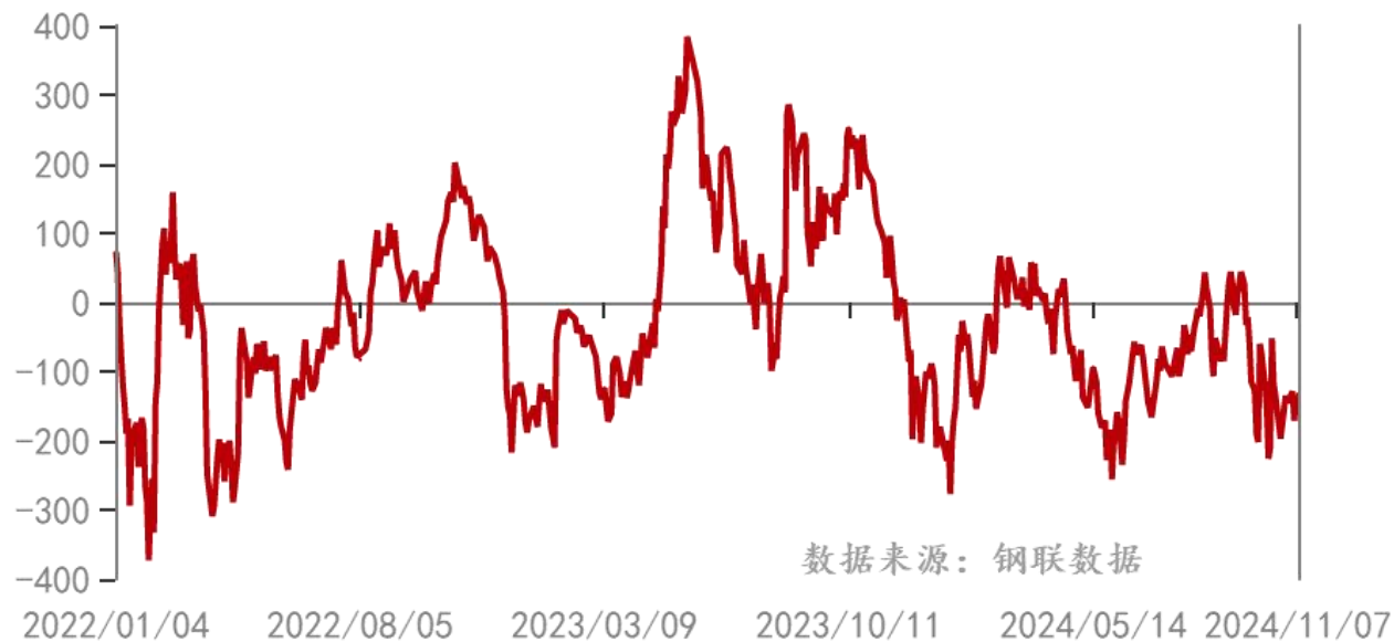
浮法玻璃：期末库存：中国（周）